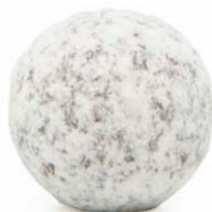
MARC DE CHAMPAGNE

La dolcezza del cioccolato bianco in tutta la sua purezza